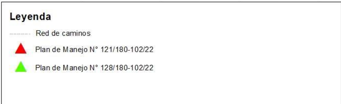
Figura 1. Localización de predios en Fundo Huitrapulli objeto de la solicitud de cotización.