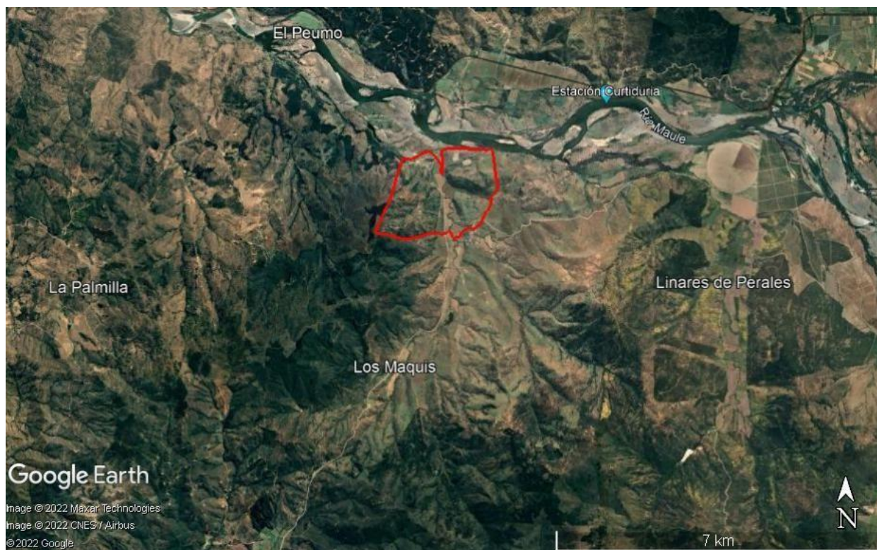
Figura 1. Ubicación del Predio Los Maquis, Lote B, en color rojo) y acceso referencia UTM 230.785–6.068.881 Datum WGS84 H 19.