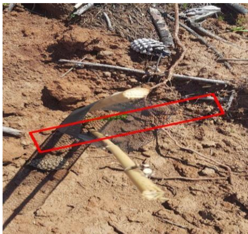
Figura 4. Disposición de los tutores relativa al pliegue de la protección (en rojo).

6.7 Cumplimiento de Aspectos Ambientales y Sociales: El servicio se deberá ejecutar bajo un enfoque preventivo, asegurando la aplicación de medidas de prevención de riesgos ambientales y sociales asociados a la ejecución de actividades descritas. El equipo regional FAO/CONAF proporcionará una tabla de gestión ambiental y social (Anexo V), que describa para cada actividad a ejecutar, las medidas de prevención de riesgos de tipo ambiental y/o social, que deberán ser implementadas por la empresa ejecutora. Además, deberá cumplir con las prescripciones y medidas de protección establecidas en el plan de manejo aprobado por la CONAF. Asimismo, la empresa ejecutora deberá generar los medios de verificación propuestos para dar cuenta de su aplicación, la que podrá ser actualizada en función de la aparición de nuevas amenazas, medidas de prevención o bien acciones de mitigación, lo cual deberá ser acordado por el equipo FAO/CONAF, la empresa y la persona beneficiaria.